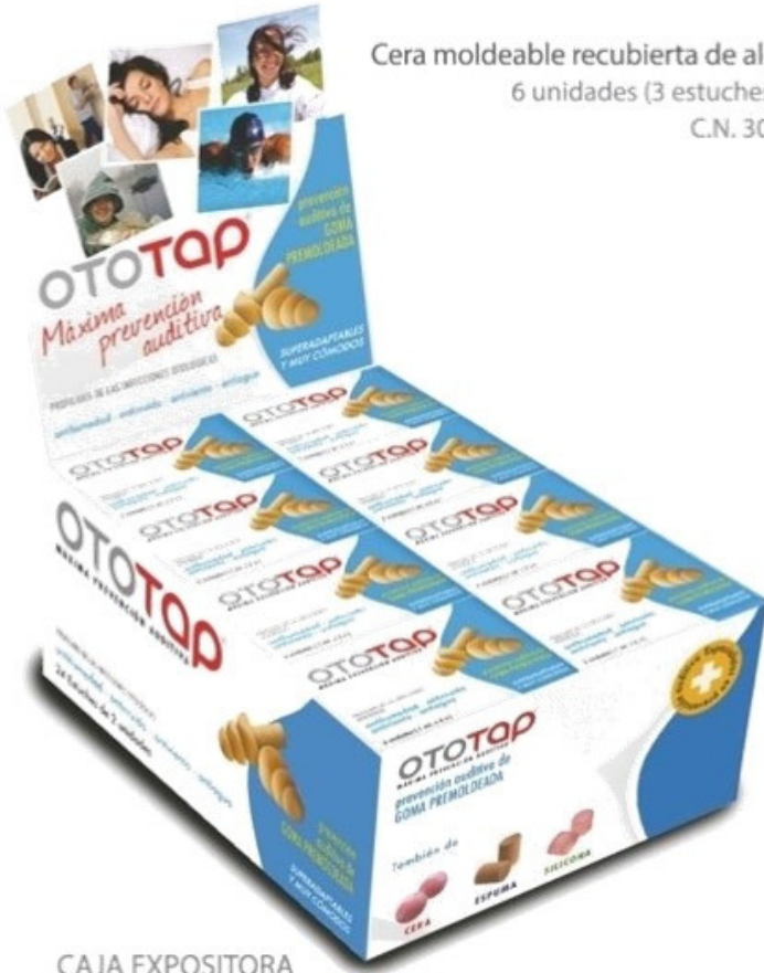
CAJA EXPOSITORA con 24 estuches

Cera moldeable recubierta de algodón 6 unidades (3 estuches x 2 u). C.N. 304261.1